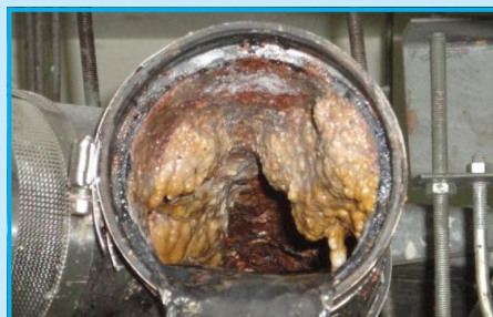
Через 2 недели использования препарата