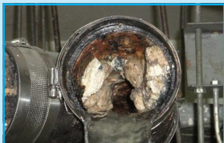
До использования препарата